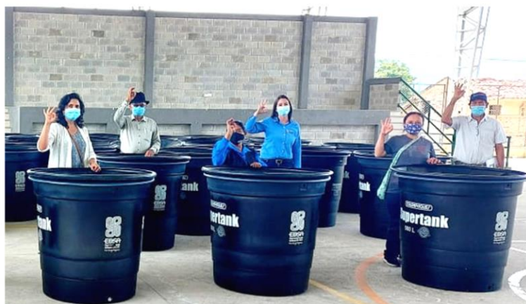
Vereda Centro, Pachavita. 54 Tanques de Almacenamiento de 500 Litros