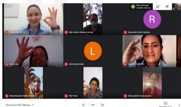
Asociación Madres Comunitarias -Saboyá