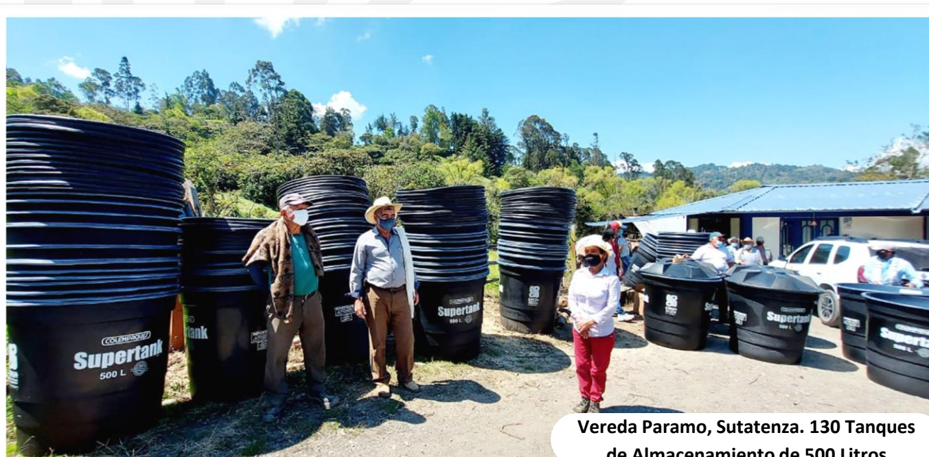
Vereda Paramo, Sutatenza. 130 Tanques de Almacenamiento de 500 Litros

EBSA pensando en la calidad del vida, salubridad y bienestar de los habitantes de las Veredas Cardonal y Carrizal (Jenesano), Quebradas y Chaguatoque (Tenza), Paramo (Sutatenza) y Centro (Pachavita) hace entrega de 411 Tanques de Almacenamiento de Agua Potable con accesorios, con el fin de mejorar el sistema de abastecimiento de agua potable. Esta iniciativa nace como parte de las compensaciones sociales por la construcción del Proyecto de Interconexión a 115 kV entre las provincias Centro, Márquez, Neira y Oriente.