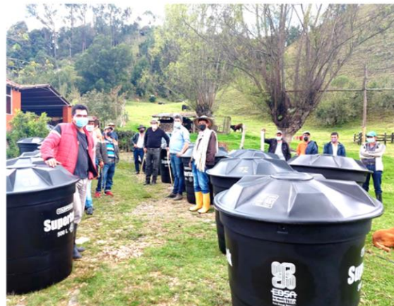
Vereda Carrizal sector Jaimes, Jenesano. 75 tanques de almacenamiento de 500 litros