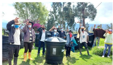
Vereda Carrizal sector Bajo, Jenesano. 38 Tanques de Almacenamiento de 500 Litros