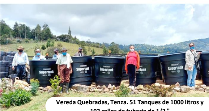
Vereda Quebradas, Tenza. 51 Tanques de 1000 litros y 102 rollos de tubería de 1/2 "