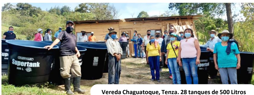
Vereda Chaguatoque, Tenza. 28 tanques de 500 Litros