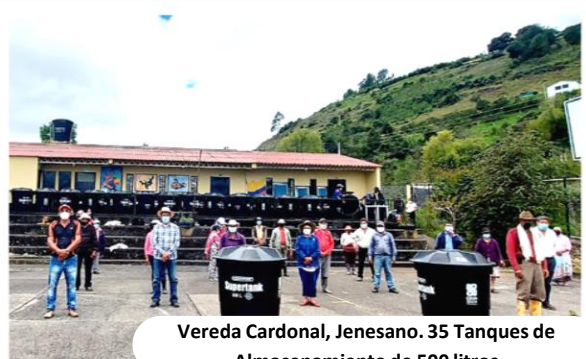
Vereda Cardonal, Jenesano. 35 Tanques de Almacenamiento de 500 litros