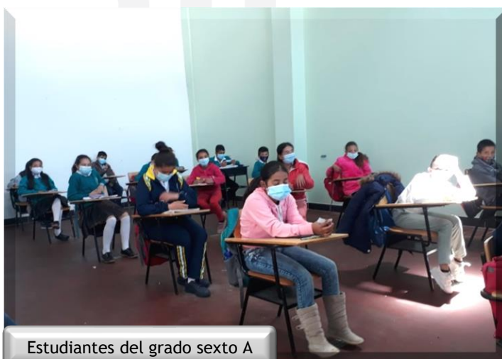
Estudiantes del grado sexto A

3. Taller de Ciberadicción, dirigido a estudiantes del grado sexto, cuyo objetivo fue identificar el tiempo de interacción con las tecnologías, las acciones cognitivas y conductuales que los pueden llevar a un caso de Ciberadicción.