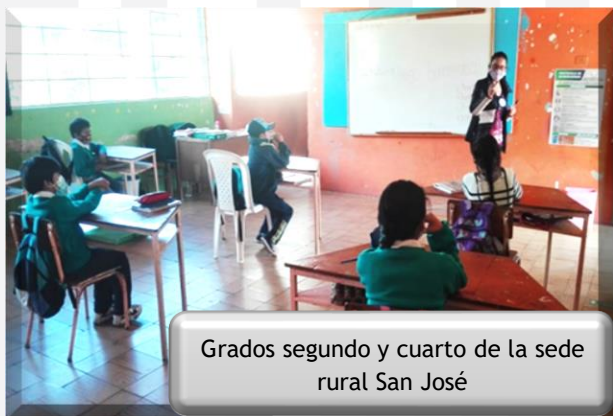
Grados segundo y cuarto de la sede rural San José

1. Taller sobre manejo de emociones, con el objetivo de enseñar a los niños a reconocer y gestionar sus emociones, a través de actividades lúdico - pedagógicas, dirigidos a los grados: kínder, primero, segundo y cuarto de la sede rural San José.