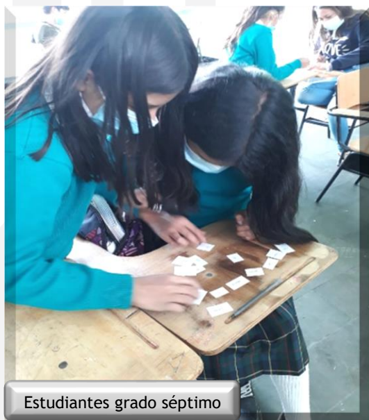
Estudiantes grado séptimo

2. Taller de Control de ansiedad, donde se identificaron síntomas orgánicos y mentales producidos por la ansiedad, así como estrategias de afrontamiento por medio de la autogestión, relajación, la búsqueda de apoyo a nivel familiar, entre otras, dirigido a estudiantes del grado séptimo de la sede central del ITA.