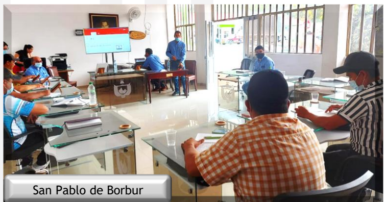
San Pablo de Borbur