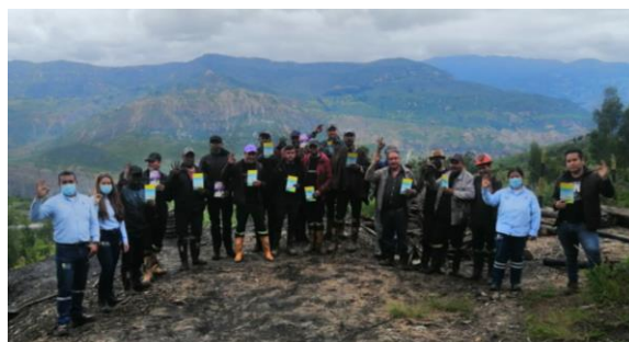
Socotá- Mina Marrubial SAS

Con el objetivo de establecer canales de comunicación fluidos y de doble vía con nuestros usuarios, seguimos visitando a la población trabajadora de nuestro departamento. En esta oportunidad nos dirigimos al sector minero de Socotá, donde, por medio de dos encuentros realizados con los colaboradores de las Minas El Carmen y Marrubial, el equipo social del PERPE socializó las acciones adelantadas por la EBSA dentro del Plan Empresarial de Reducción de Pérdidas de Energía - PERPE que actualmente ejecuta la Compañía en favor del uso legal del servicio de energía.