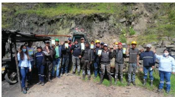
Socotá- Mina El Carmen SAS