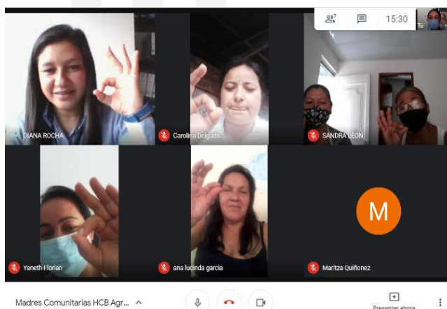
Madres Comunitarias Pauna