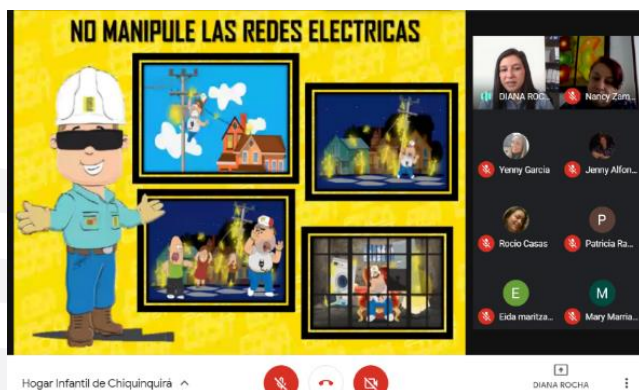
Hogar Infantil Chiquinquirá

La Empresa de Energía de Boyacá - EBSA, realizó encuentros virtuales con el cuerpo docente del Hogar infantil de Chiquinquirá y las madres comunitarias del municipio de Pauna, a quienes dio a conocer el Plan Empresarial de Recuperación de Pérdidas de Energía - PERPE, las acciones que se llevan a cabo desde este y algunos temas de interés para hacer un uso seguro y racional del servicio de energía eléctrica. Con estos encuentros, la EBSA busca generar conciencia en sus usuarios de los riesgos que trae consigo el uso indebido del servicio.