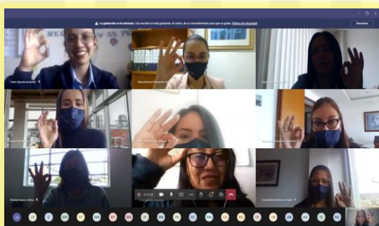
Medimás EPS - Tunja

Esta semana la Empresa de Energía de Boyacá realizó dos encuentros virtuales con los trabajadores del sector salud; el primero con los funcionarios de la E.S.E Centro de Salud de Gámbita, Santander, y el segundo con los funcionarios de la EPS Medimás de la ciudad de Tunja, donde se trabajaron los temas relacionados con el uso racional, eficiente y seguro de la energía eléctrica, y se dieron a conocer la novedades en relación a los canales de comunicación que ha habilitado la EBSA para los trámites de todos sus usuarios.