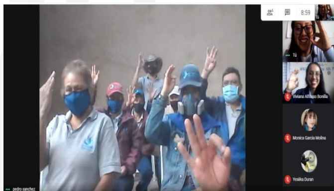
ACUEDUCTO DE SAMACÁ

Esta semana EBSA se encontró virtualmente con los funcionarios del Acueducto de Samacá y la Mina Coralitos de este mismo municipio. Durante estos encuentros se abordaron temas transversales y de utilidad relacionados con la prestación del servicio, ahorro de energía, seguridad eléctrica, canales de comunicación e información relacionada con el Plan Empresarial de Recuperación de Pérdidas de Energía (PERPE). Se resolvieron dudas e inquietudes de los asistentes y se evidenció el interés frente a la importancia de dar un uso adecuado al servicio. Finalmente, los participantes se comprometieron a ser parte activa de nuestra política de seguridad empresarial “Cero incidentes de alto riesgo”.