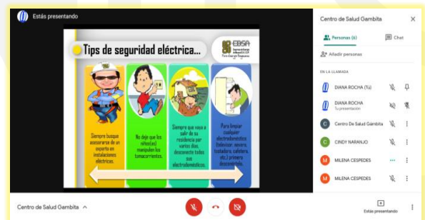
E.S.E Centro de Salud de Gámbita - Santander