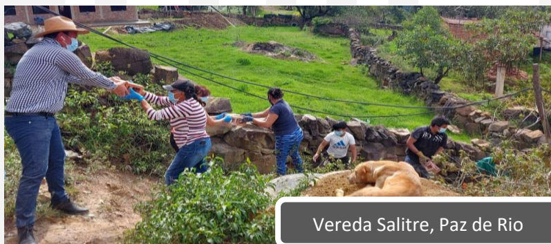
Vereda Salitre, Paz de Rio