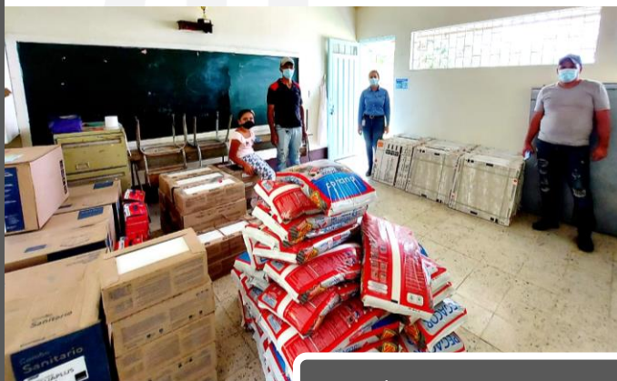
Vereda Aposentos, Tenza

En el mismo sentido, EBSA hizo entrega de materiales para mejoramientos locativos del Aula Múltiple de la Institución Educativa Técnica de Valle de Tenza (Guateque) y mejoramientos locativos de las sedes de Barzal y Aposentos de la Institución Educativa Técnica José Gabriel Carvajal (Tenza).