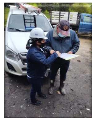
Visitas Provincia Centro de Boyacá

El grupo de Gestión Comunitaria del PERPE, continúa brindando apoyo a nuestros usuarios, realizando orientación con respecto a los requisitos para llevar a cabo su proceso de matrícula con la empresa. Por medio de las visitas realizadas esta semana en los municipios de Turmequé, Tunja, Sáchica y Chiquinquirá, se lograron verificar los documentos gestionados y su tiempo de vigencia con el propósito de evitar demoras en los procesos.