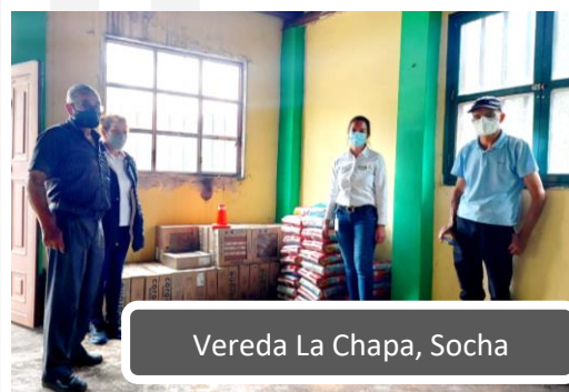
Vereda La Chapa, Socha