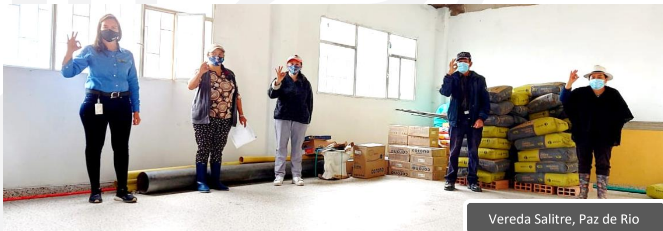
Vereda Salitre, Paz de Rio

Es así como EBSA inspirada con buena energía deja huella social a su paso, dado que estas obras están ubicadas en el área de influencia del proyecto “Construcción línea 115 kV Sogamoso – Boavita”.