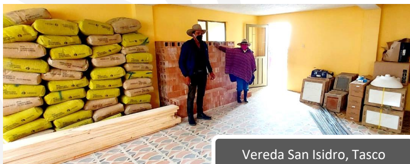
Vereda San Isidro, Tasco