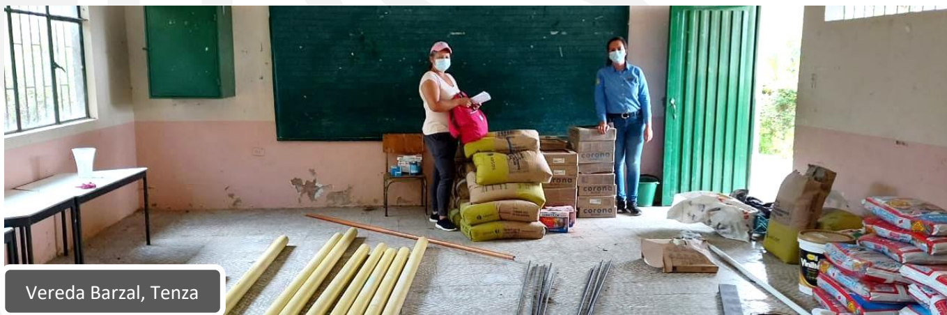
Vereda Barzal, Tenza

Estas obras sociales hacen parte de las compensaciones sociales del Proyecto de Interconexión 115 kV de Energía Eléctrica Centro, Márquez, Neira y Oriente.