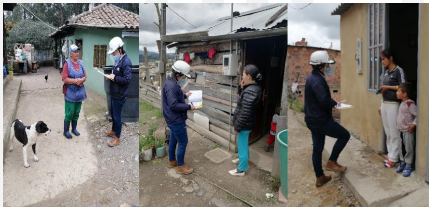
Visitas Provincia Occidente de Boyacá

El grupo de Gestión Comunitaria del PERPE, continúa brindando apoyo a nuestros usuarios, realizando orientación con respecto a los requisitos para llevar a cabo su proceso de matrícula con la empresa. Por medio de las visitas realizadas esta semana en los municipios de Turmequé, Tunja, Sáchica y Chiquinquirá, se lograron verificar los documentos gestionados y su tiempo de vigencia con el propósito de evitar demoras en los procesos.