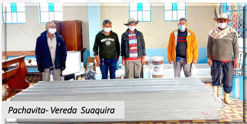
Pachavita- Vereda Suaquira