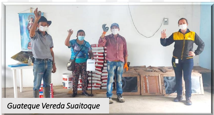
Guateque Vereda Suaitoque

EBSA hizo entrega de materiales para mejoramientos locativos del Salón Comunal de la Vereda Suaitoque (Guateque) y mejoramientos locativos de la Capilla de la Vereda Suaquira (Pachavita) como compensaciones sociales del Proyecto de Interconexión 115 kV de Energía Eléctrica Centro, Márquez, Neira y Oriente.