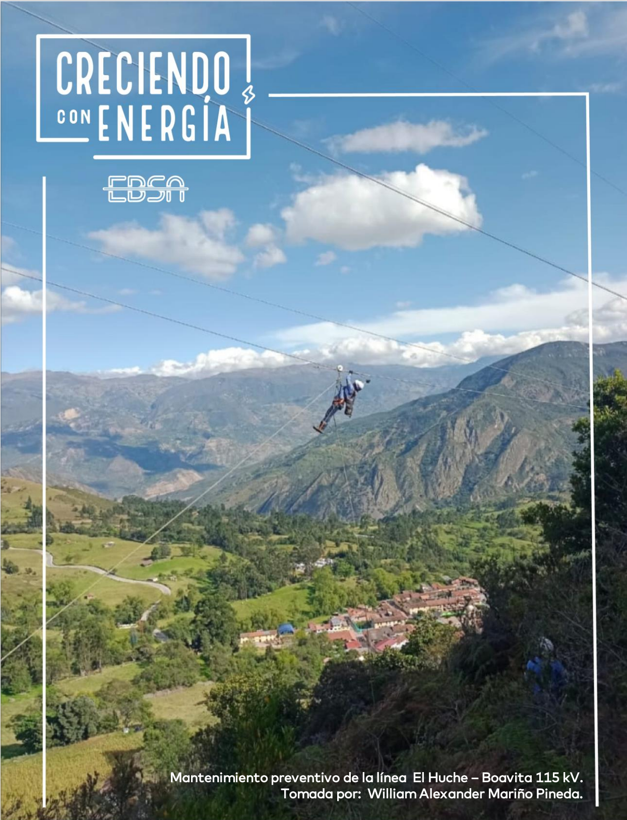
Mantenimiento preventivo de la línea El Huche – Boavita 115 kV.