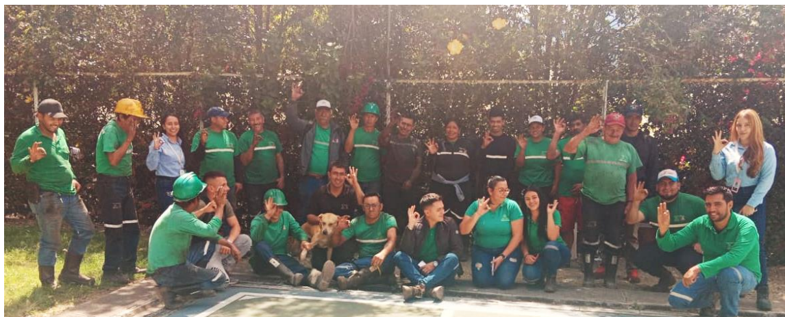
Grupo Empresarial CI – Municipio de Socha

El pasado 15 de febrero el equipo de gestión social del PERPE realizó un encuentro con el personal de grupo CI-Mina Carbón del municipio de Socha, donde dio a conocer el Plan Empresarial de Recuperación de Pérdidas de Energía, con el fin de garantizar el uso legal del servicio a través de la aclaración de dudas frente a la documentación necesaria para la legalización.