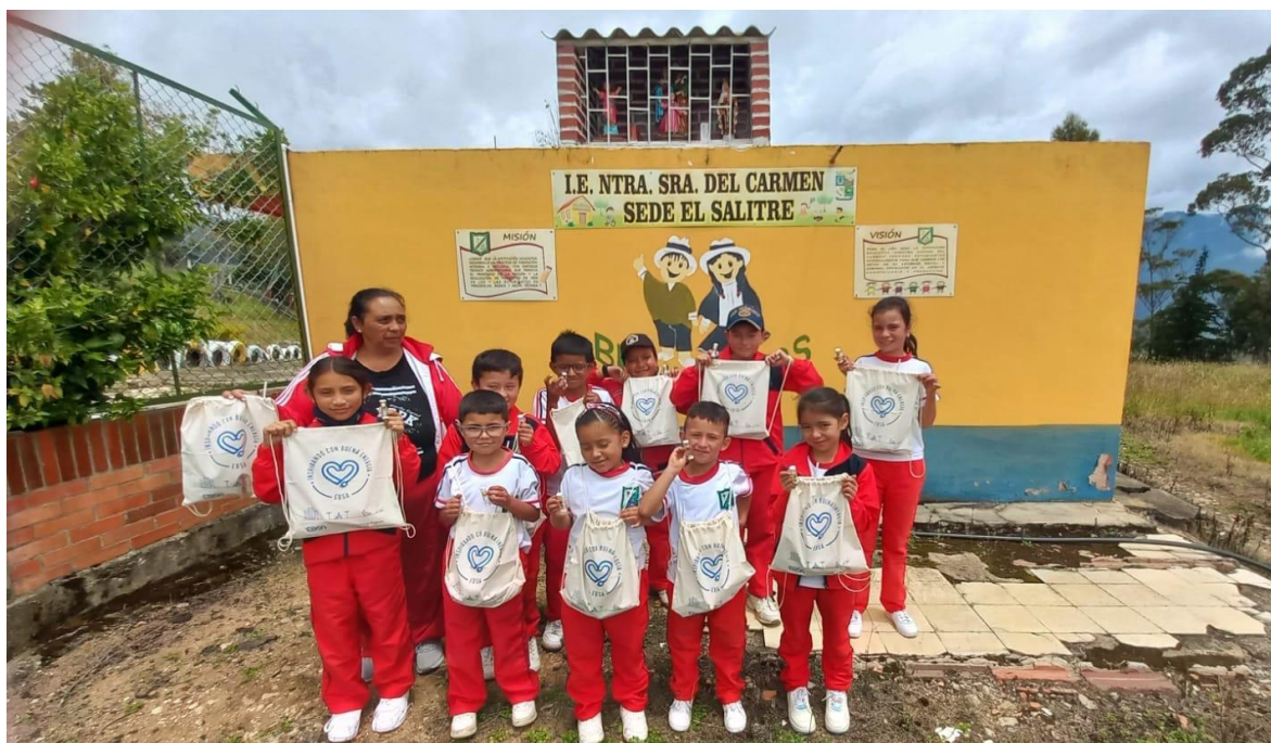
Institución Educativa Nuestra Señora del Carmen sede Salitre de Susacón.