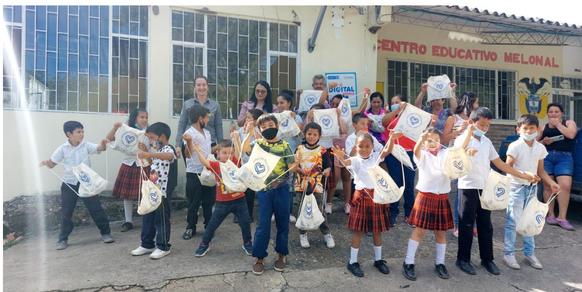
Institución Educativa Técnico Agrícola de Boavita - Sede Melonal

Con el fin de fortalecer la cultura ambiental en las comunidades del área de influencia de los Proyectos de Transmisión, EBSA junto con la Universidad Santo Tomás, realizaron la Capacitación en hábitos para el manejo adecuado de los residuos sólidos, las aguas residuales y cuidado del recurso hídrico con los estudiantes y docentes de la Institución Educativa Técnico Agrícola de Boavita - Sede Melonal, Escuela Normal Superior La Presentación sede Chorrera de Soatá y en la Institución Educativa Nuestra Señora del Carmen sede Salitre de Susacón.