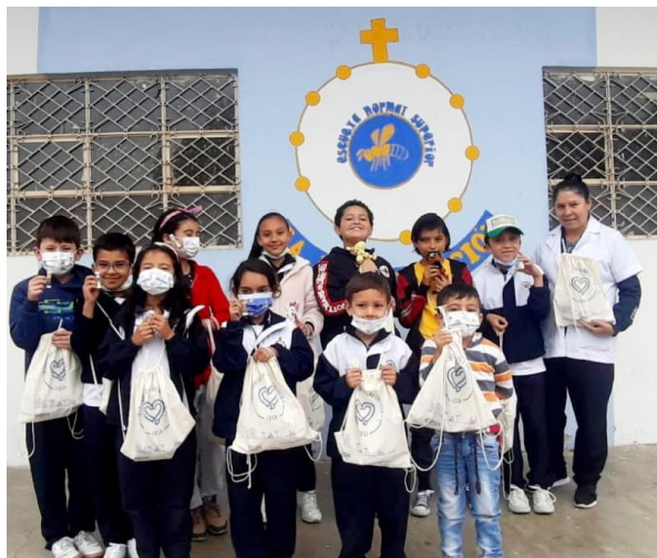
Escuela Normal Superior La Presentación sede Chorrera de Soatá

Asimismo, con el fin de sensibilizar frente al cuidado de los recursos naturales, se hizo entrega de bolsas ecológicas para reducir el uso de bolsas contaminantes para el medio ambiente y relojes de arena de 4 minutos, ideales para contabilizar el tiempo en la ducha y de esa forma ahorrar agua en los hogares, sumando estas acciones para la protección y preservación del medio ambiente.