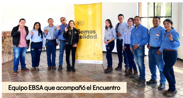
Equipo EBSA que acompañó el Encuentro

En la jornada EBSA les hizo entrega de un casco como aporte a su seguridad.